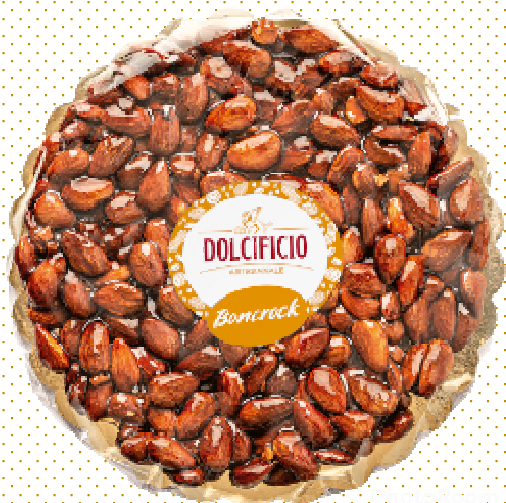
TORTINO CROCC. MANDORLAgr 350 x6 DVENETO