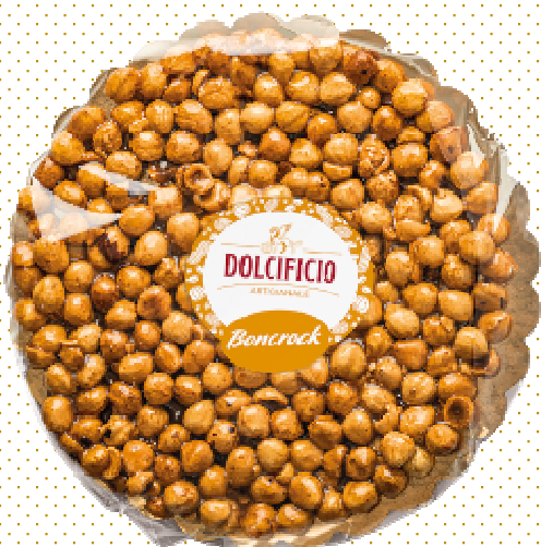
TORTIN. Di CROCCANTE Di NOCCIOLE G350 DVENETO