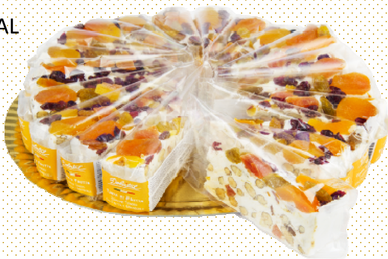
TORRONE TORTA NOCCIOLE E CIOCC. G110X20 DOLCITAL