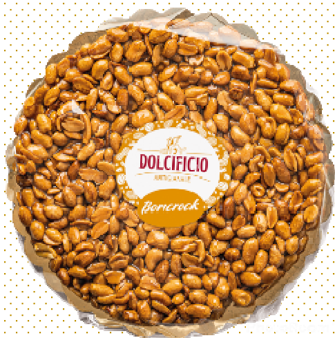
TORTIN. CROCCANTE ARACHIDI G350 DVENETO