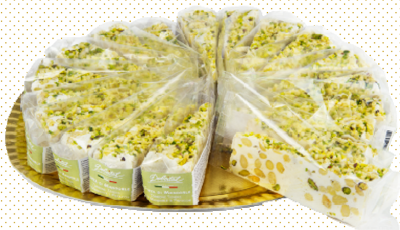
TORTA TORRONE MANDORLE PISTACCHI G110X20 DOLCITAL