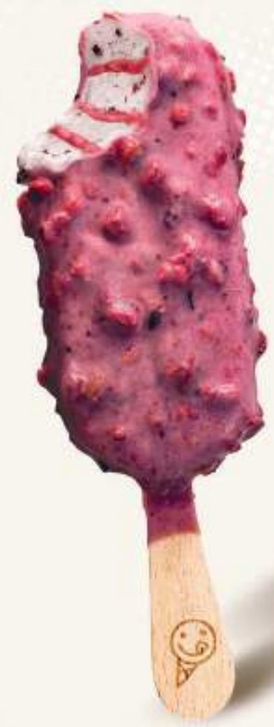
MIRTILLO INASPETTATO Gelato al gusto vaniglia, con variegatura ai mirtilli, copertura al gusto yogurt, fragole e mirtilli disidratati e granella di biscotti.