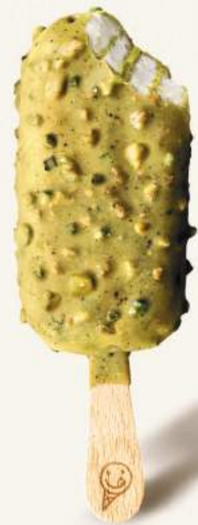
PISTACCHIO SINCERO Gelato al gusto vaniglia con pistacchio in variegatura e copertura, con granella di pistacchi e biscotti.