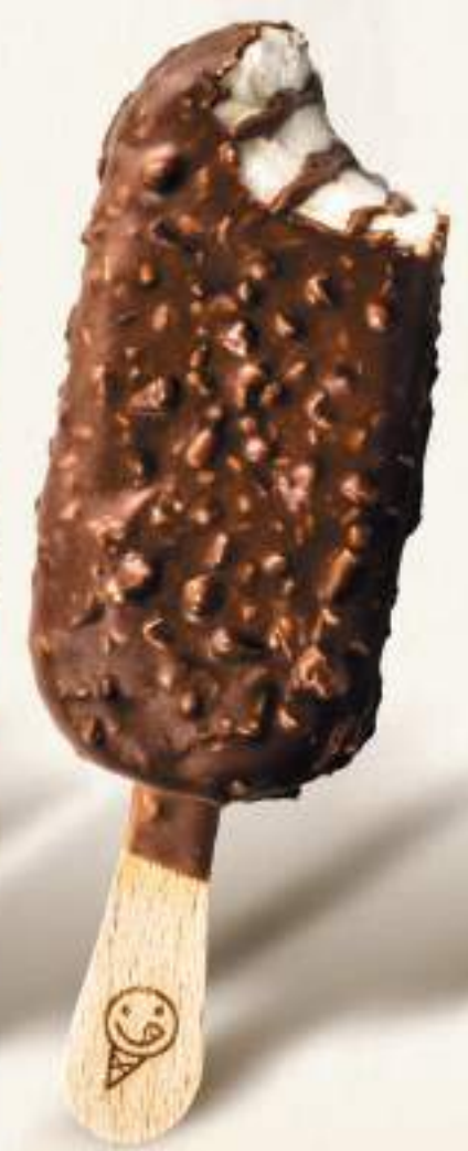
COCCO BELLO Gelato al cocco con cacao e latte in variegatura e copertura, con cocco e granella di biscotti.