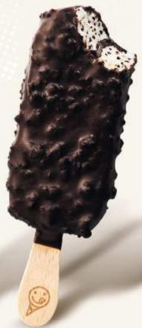
STRACCIATELLA MAIVISTA Gelato al gusto vaniglia, con scaglette di cioccolato, variegato al cioccolato e copertura al cioccolato con granella di biscotti.