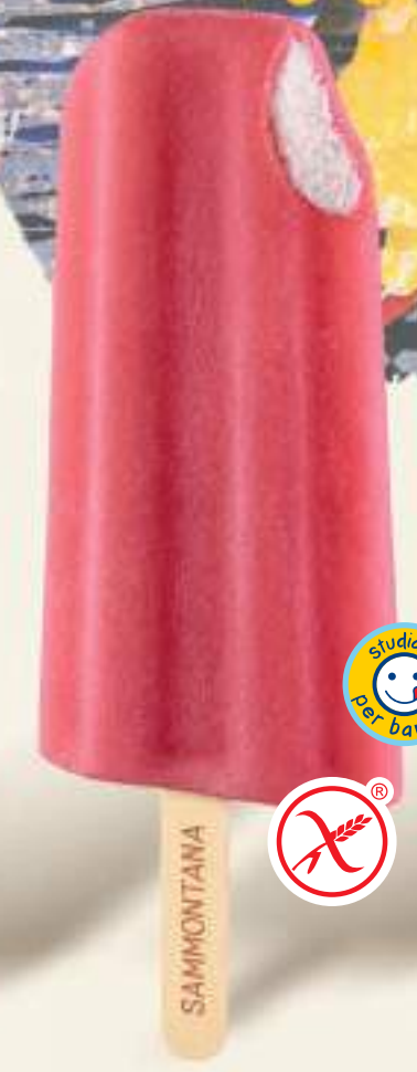
FRAGOLINO Ghiacciolo alla fragola con ripieno di gelato al gusto vaniglia.