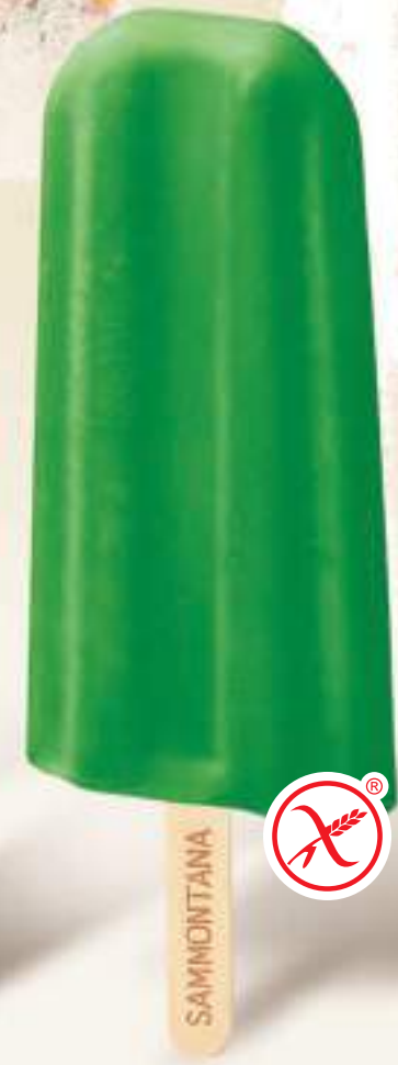
GHIACCIOLO Ghiacciolo ai gusti assortiti: limone, arancia, menta, amarena.