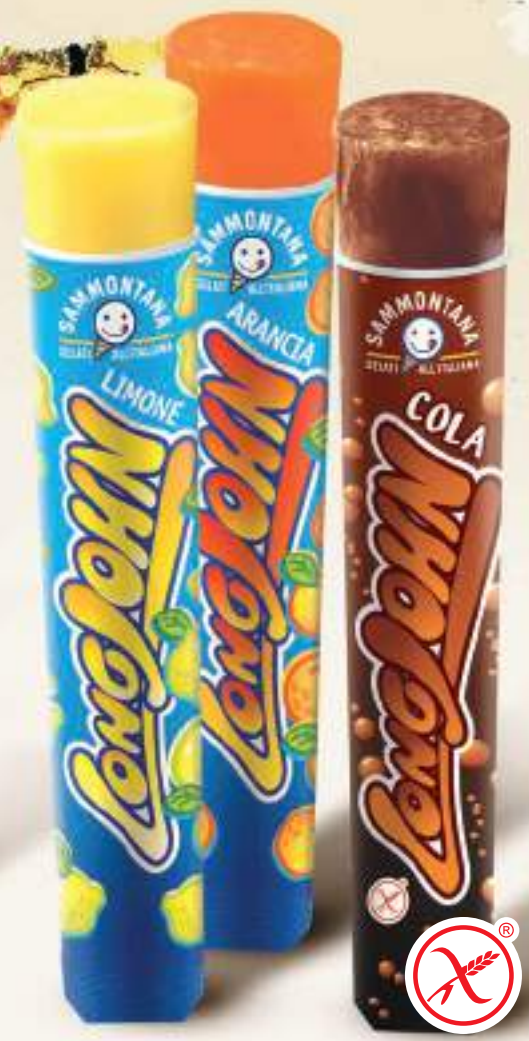
LONG JOHN Ghiacciolo push up in tre gusti: limone / arancia (cartone assortito) cola.

Sorbetto alla fragola ricoperto di ghiacciolo ai gusti bubblegum e mela verde. Sorbetto al gusto cola ricoperto di ghiacciolo ai gusti arancia e limone.