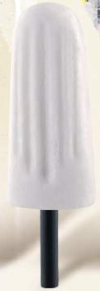
LIPPERLÌ Ghiacciolo al gusto limone con stecco di liquirizia.