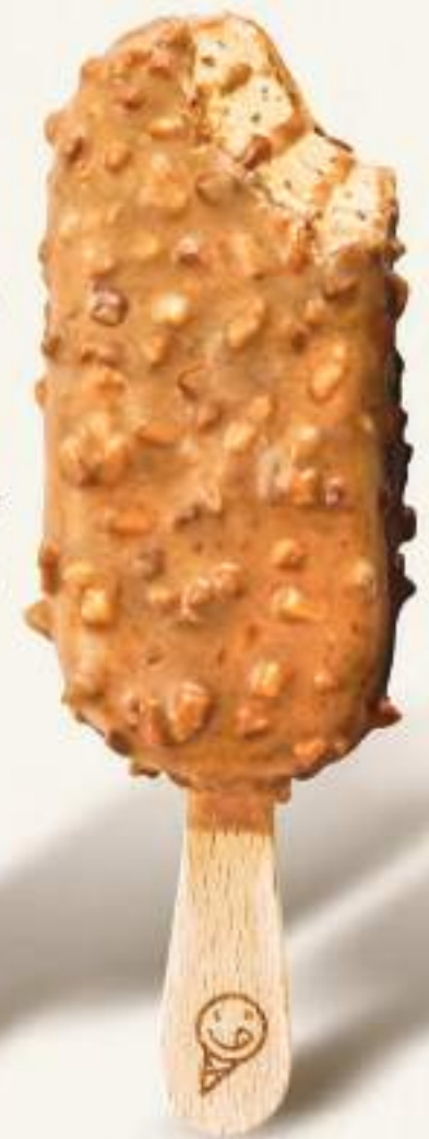
MITICO CROCCANTINO Gelato al gusto vaniglia con caramello salato in variegatura e copertura, con granella di mandorle e biscotti.